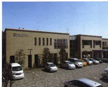
阿久和地域ケアプラザ