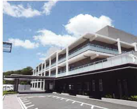
ゆうあいの郷 衣笠